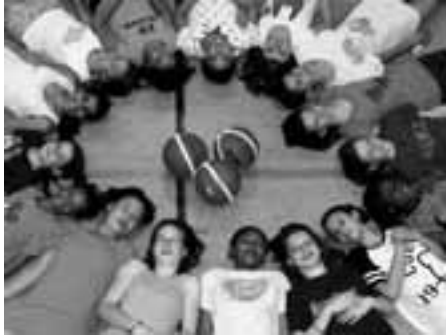
Die Mädels vom Post SV beim Abschlusstraining

Am ersten Juli-Wochenende war es endlich soweit - die Mädels der U13 und U15 vom Post SV Nürnberg feierten gemeinsam das Ende der Saison mit der lang ersehnten Übernachtung in ihrer Trainingshalle. Fließt dort normalerweise der Schweiß in Strömen durch die vom Trainer geforderte sportliche Betätigung, war an dem heißesten Wochenende des bisherigen Sommers der Schweiß alleine durch die Hitze