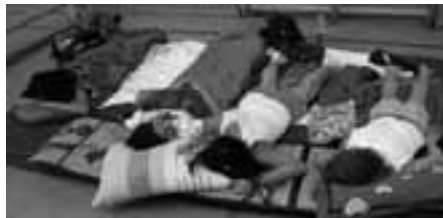
Das Schlaflager in der Trainingshalle