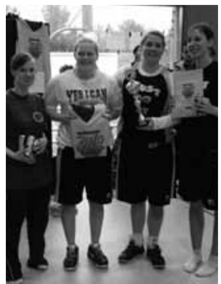
Die Siegerteams v. oben: Gruppe Mädels - Nürnberg Magics, Jungen - Magic B Ballers, Damen - Just Do It