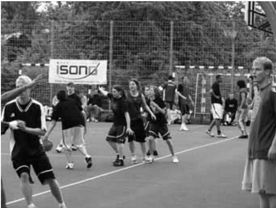
Trotz unfreundlicher Temperaturen startete das Turnier in bester Stimmung

nur einzelne Tropfen, die Runde wird noch beendet. Der Wetterbericht soll aller Hoffnung zum Trotz recht behalten mit der Regenvorhersage. Die letzten Vorrundenspiele vor der Mittagspause werden sofort in die Halle verlegt. Dank der Erfahrungen aus dem letzten Jahr und dementsprechend guter Vorbereitung geht der Umzug rasend schnell von statten. Und irgendwie drängt sich der Eindruck auf die Mannschaften sind sehr dankbar in der warmen Halle weiterspielen zu dürfen, die sich sehr schnell füllt. Keine zehn Minuten später gehen die Spiele weiter – nicht zu früh, draußen bricht die Sintflut los. Lediglich die Turnierleitung, Essensverkauf und