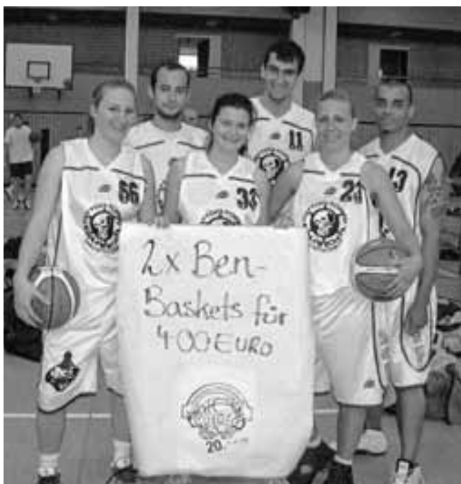
„2x Ben-Baskets für 400 Euro“ von den Noris Baskets holten sich den 3. Platz

waren gleich mit drei Teams angereist und standen als „2x Ben-Baskets für 400 Euro“ jetzt den Post SV Spielern gegenüber. In dem hart umkämpften Spiel für den letzten Platz auf dem Siegerpodest hat ein Punkt den entscheidenden Unterschied gemacht. Die Spieler und Spielerinnen von Noris Baskets freuten sich über den dritten Platz und das Post Team wurde undankbarer Vierter. Dennoch eine