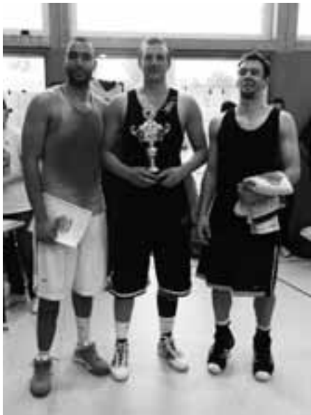
Sieger der Herren: Das Team Go to Hell